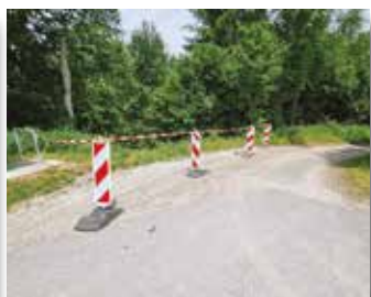
Erdbewegungen im Bereich Schweigstätt in Richtung Edmühle - die Bahn ist als Eigentümerin der Fläche informiert

Die Bürgerviertelstunde ergab keinerlei Wortmeldungen, so verlas der Vorsitzende als Tagesordnungspunkt 1 der Sitzung die gefassten Beschlüsse des nichtöffentlichen Teils der Sitzung des Gemeinderates am 23.05.2023: