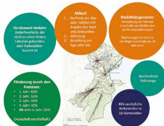
Das Prinzip des app-gestützten On-Demand-Projektes im Chiemgau-Bereich

Der Gemeinderat Soyen steht der Teilnahme am geplanten Projekt ROSI - Mobil für den nördlichen Landkreisbereich grundsätzlich positiv gegenüber und möchte über die weitere Projekt-Entwicklung informiert werden. Geklärt werden soll die Option der landkreisüberschreitenden Nutzung in Hinblick auf das benachbarte Mittelzentrum Haag i. OB sowie die Erreichbarkeit der Stadt Wasserburg a. Inn.