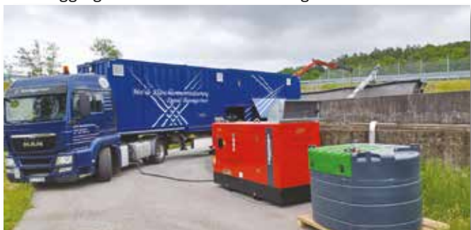
Bereits im Einsatz bei der Klärschlammpressung - das neue Stromaggregat in der Zentralkläranlage

Ebenfalls positiv zu bewerten sind die ersten Einsätze des Stromaggregates in der Zentralkläranlage in Mühlthal.