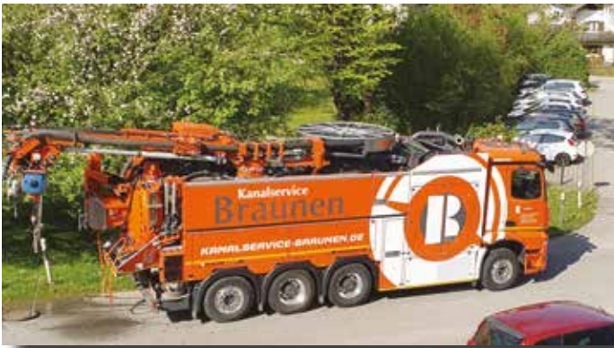
Die Fa. Braunen führt im Auftrag der Gemeinde Soyen Kanalbefahrungen bzw. Kanalvermessungen im gesamten Gemeindegebiet durch

Unübersehbar ist das Spezialfahrzeug der Fa. Braunen, die derzeit Kanalbefahrungen bzw. Kanalvermessungen im Gemeindegebiet durchführt. Hierüber wurde bereits in vorausgegangenen Berichten sowie im Bürgerblatt Soyen berichtet.