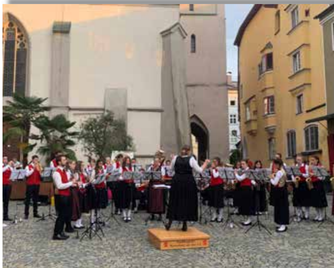
In 2022 nahmen 11 Jugendliche aus dem Gemeindebereich Soyen an der Jugendausbildung der Stadtkapelle Wasserburg a. Inn teil